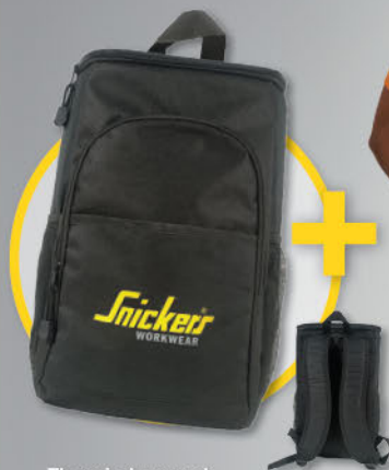
Thermische rugzak (Ter waarde van € 29,90 excl. btw)