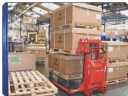
Sa construction puissante lui assure une longue durée de vie et de faibles coûts de maintenance.