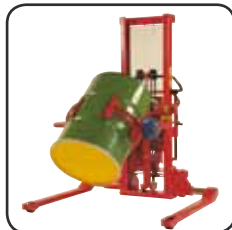
Options disponibles: Retourneur de fûts, mise à niveau automatique, fourches basculantes etc.

Disponible avec levée manuelle et électrique.