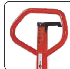
Le timon ergonomique assure à l'opérateur un confort d'utilisation et le gerbeur peut être personnalisé avec le nom de l'entreprise/service.