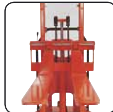
Les fourches réglables sont disponibles en option avec de nombreuses longueurs et types.