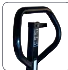
Ergonomisch handvat verzekert een relaxte grip.