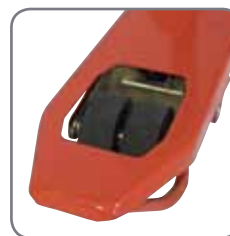
Dubbele wielen voor gemakkelijk veranderen van richting.