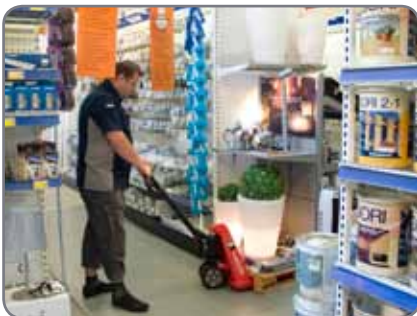
Gemakkelijke goederenbehandeling is verzekerd zelfs in beperkte ruimtes.