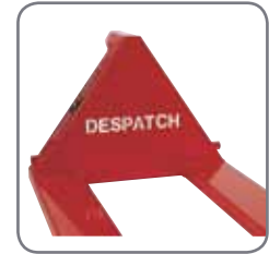
De naam van het bedrijf of het logo kan worden gefreesd in de driehoek van de Panther Silent.