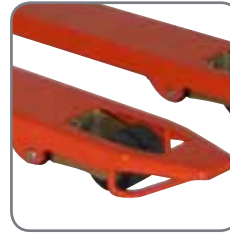
De beugels aan de vorken verzekeren een gemakkelijk in- en uitrijden van paletten.