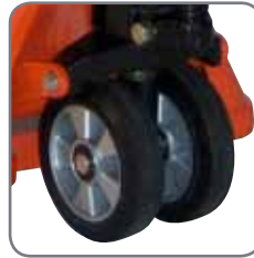
De speciale rubberen wielen zijn zacht voor delicate vloeren en hebben antistatische kwaliteiten.