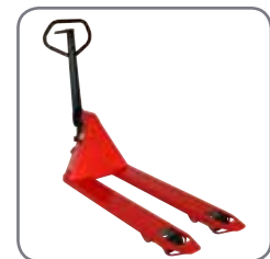
De Panther Silent is voorzien van een permanente quick lift.

Wij bieden eveneens op maat gemaakte oplossingen. Vraag meer informatie, of bezoek www.logitrans.com