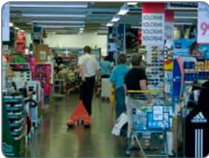
Panther Silent in een supermarkt, waar het comfort en welzijn van de klant primeert.