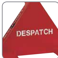
Kan voorzien worden van Naam/Afdeling.