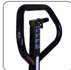
Ergonomisch handvat verzekert de gebruiker een relaxte greep.