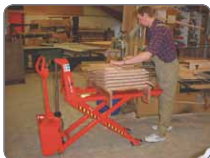
Optionele extra's: afstandsbediening, level control, rem, Externe of ingebouwde lader.