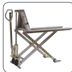
Verkrijgbaar in de versies manueel, elektrisch, roestvrij en explosievrij gekeurd.