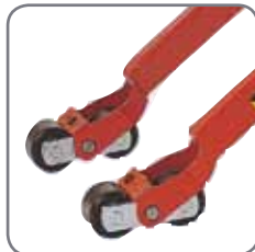
De dubbele vorkwielen hebben een remeffect en zijn niet schadelijk voor de vloer.