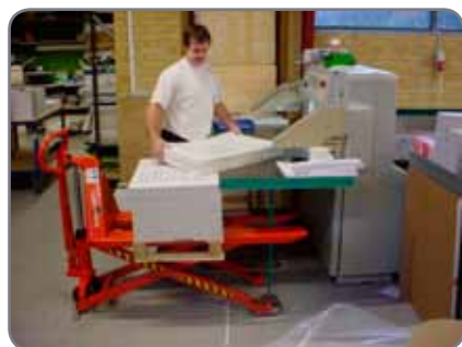
Minimum kracht nodig voor het manueel heffen, voorzien van voetbescherming en neutrale positie.