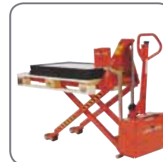
Level control (optionele extra) verzekert een constante ergonomische werkhoogte.