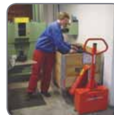
Gepatenteerde cylinder-constructie verzekert een lage bouwhoogte.

Wij bieden eveneens op maat gemaakte oplossingen. Vraag meer informatie, of bezoek www.logitrans.com